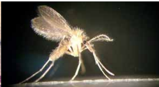
F. Montarsi. Flebotomo